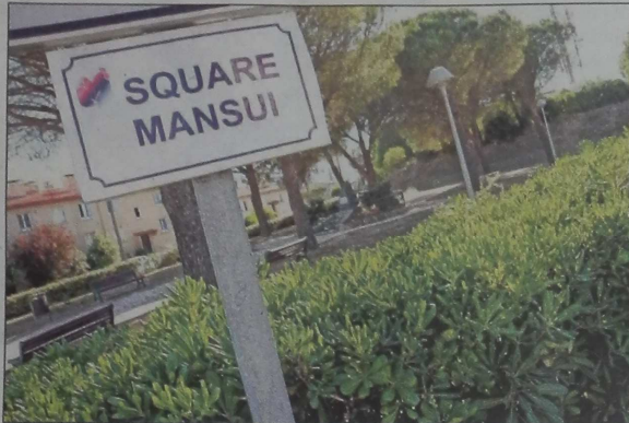
Le conseil municipal a décidé de nommer le parking contigu au du square Mansui, Maurice-Barrès.