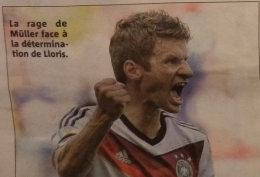
La rage de Müller face à la détermination de Lloris.

Voilà un quart de finale de Coupe du monde très attendu... P 2 À 7 ET 28 À 31